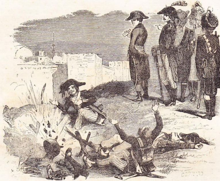
Si c'est de cette façon que les paroissiens de ce pays soignent la soupe...

pacha tendit d'une main sanglante son sabre au général Murat ; deux cents hommes se rendirent avec lui, deux mille restèrent sur le champ de bataille, dix mille se noyèrent. Vingt pièces de canon, les tentes, les bagages, tombèrent en nos mains ; le fort d'Aboukir fut repris et on rejeta les Mamelucks au fond du désert.